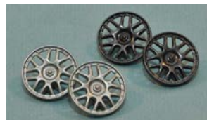
SC7610 "BBS Racing" (alte Ausführung)

4 Stück der folgenden Typen von Felgeneinsätzen müssen am Fahrzeug montiert sein (Ausnahme: Materialausgabe der Hinterräder):