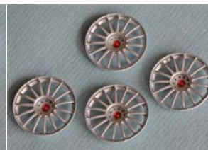
SC7618 "modern LMS"

Die Bearbeitung der Felgeneinsätze ist zur Erzielung einer angemessenen Passform zulässig. Maßnahmen, die ausschließlich/ überwiegend der Gewichts-erleichterung dienen, sind nicht erlaubt. 7)