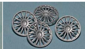
SC7615 "BBS Spoke"