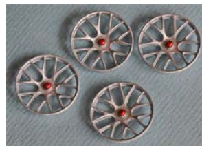
SC7610 "BBS Racing"